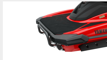
Plate-forme arrière de grande dimension et crochet de remorquage

Le moteur SVHO quatre-cylindres à haut rendement et à double arbre à cames en tête de 1,8 litre correspond à la plus grosse cylindrée sur le segment, dans un format extrêmement compact grâce à notre programme d'innovation et d'amélioration des produits. Le résultat : une puissance étonnante, une accélération et un couple épatants, associés à un fonctionnement propre et à une consommation de carburant réduite.