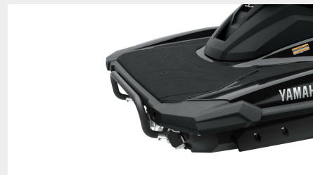
Plate-forme arrière de grande dimension et crochet de remorquage

Le moteur SVHO quatre-cylindres à haut rendement et à double arbre à cames en tête de 1,8 litre correspond à la plus grosse cylindrée sur le segment, dans un format extrêmement compact grâce à notre programme continu d'innovation et d'amélioration des produits. Le résultat : une puissance étonnante, une accélération et un couple épatants, associés à un fonctionnement propre et à une consommation de carburant réduite.