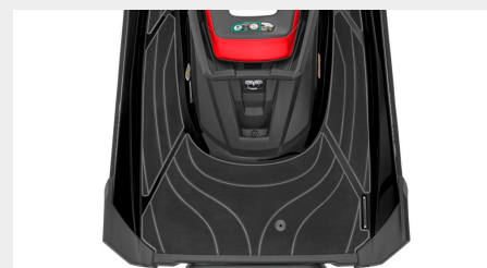
Plate-forme arrière de grande dimension et crochet de remorquage

Le dernier GP est doté d'un immense espace de rangement pour vous permettre de prendre avec vous tout ce dont vous avez besoin. Outre les immenses coffres de rangement sous la selle et à l'avant, vous disposez d'une boîte à gants très grande et pratique.