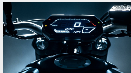
Tableau de bord LCD à affichage blanc sur fond noir

Le nouveau guidon conique en aluminium est plus long de 15 mm de chaque côté, affirmant la position de conduite et offrant aux grands gabarits la sensation de piloter une moto plus imposante tout en conservant la facilité de pilotage.