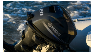
20hp outboard motor

Diagram showing the internal gear and shaft assembly of the 20hp outboard motor.