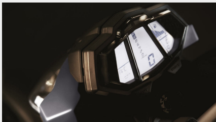
Tableau de bord High-Tech

Le poste de conduite révèle un écran High-Tech intégrant des éléments de design contemporains issus de la dernière génération de smartphones. Le tableau de bord intégral à LED accueille le conducteur au démarrage. Il inclut un affichage à barres pour le régime, la température du moteur et le niveau de carburant, de même qu'un « shift-light » et un compteur de vitesse numérique.